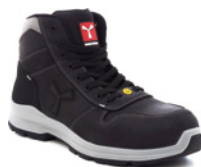
GET FORCE MID ITEM CODE 001445-0414 NBK COLOR CODE S0000