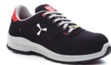
GET TEXFORCE LOW ITEM CODE 001481-0464 SUT COLOR CODE S0005