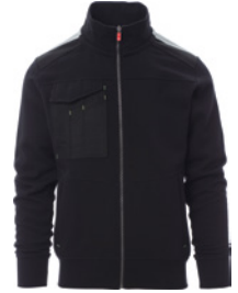
WORK 2.0 ITEM CODE 001382-0001 COLOR CODE 14000