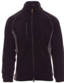
ASPEN+ ITEM CODE 001004-0069 COLOR CODE 14023