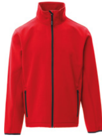
PERTH ITEM CODE 001474-0491 COLOR CODE 03000