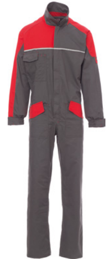
PROMOTECH ITEM CODE 000961-0340 COLOR CODE 13041