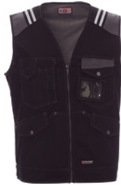
TUCSON ITEM CODE 000317-0064 COLOR CODE 14025