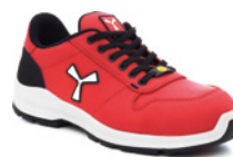
GET FORCE LOW ITEM CODE 001467-0414 NBK COLOR CODE S3000