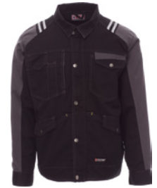
ARIZONA ITEM CODE 000319-0064 COLOR CODE 14025